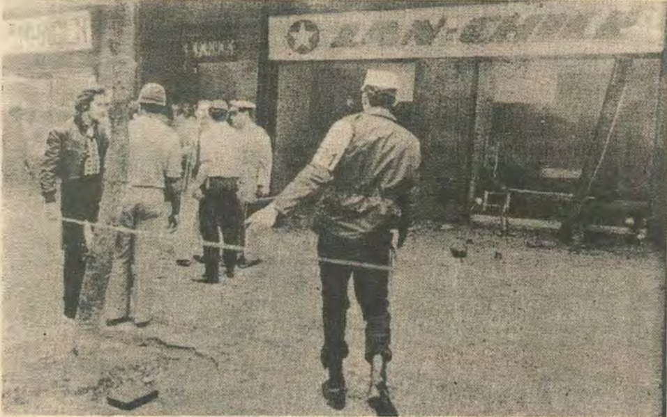
Η αντίδραση κατά της χιλιανής κυβέρνησης Εσοά, τώρα, σε άλλες χώρες. Όπως, στην συγκεκριμένη περίπτωση στο Ρίο Τανέρο, την Βραζιλία όπου ισχυρή δέσμη κατόπιν του γραφείου Πολιτικής Αεροπορίας της Χιλής. Στην φωτογραφία Βραζιλιανοί άστυνομικοί φρουρούν το κτίριο της εταιρίας.

καταδέχτηκαν να κατεβούν στο πεζοδρόμιο και να κτυπήσουν άδειες κατασάρκες πλάι - πλάι με τις υπηρέτριές τους.